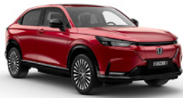
Vermillion Red Pearl