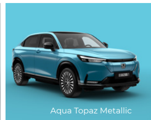
Aqua Topaz Metallic