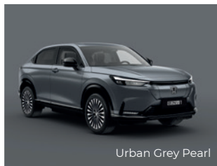
Urban Grey Pearl