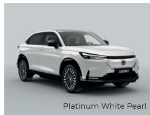
Platinum White Pearl